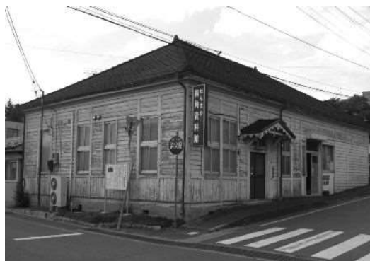
せんまや街角資料館