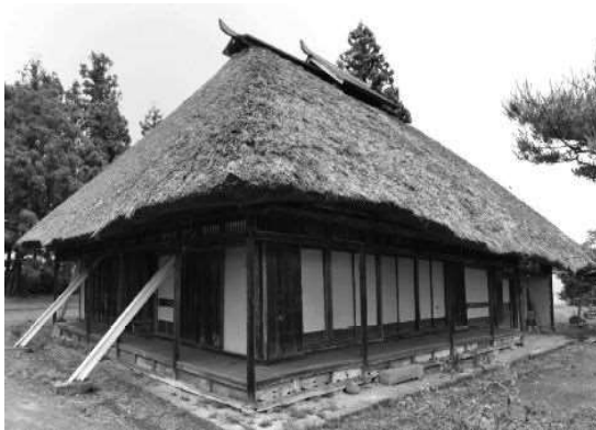
市指定有形文化財 千葉胤秀旧宅