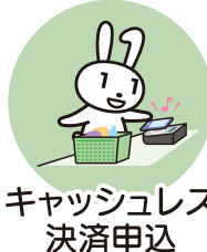
キャッシュレス 決済申込