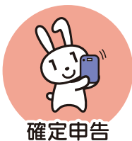
確定申告 (2024年度より)