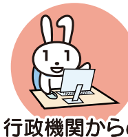
行政機関からの お知らせ・各種証明書