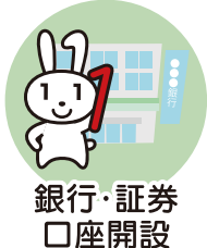
銀行・証券 口座開設