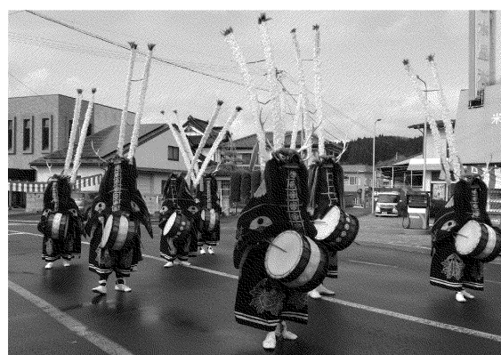
市指定無形民俗文化財 小沼鹿踊