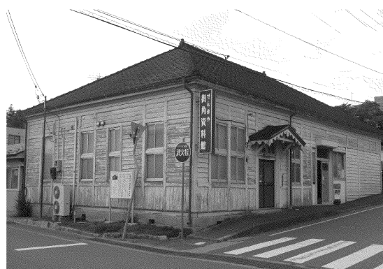
せんまや街角資料館