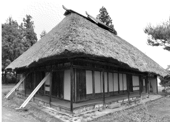
市指定有形文化財 千葉胤秀旧宅