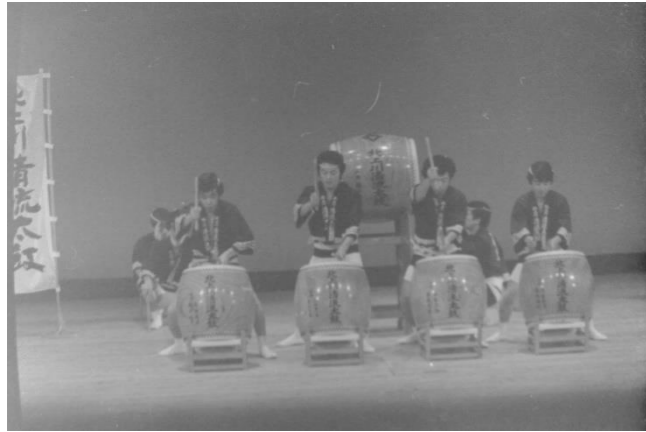
1 北上川清流太鼓(岩手町)