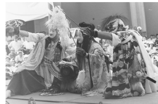
7 猿飛来神楽(栗原市)