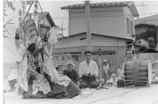
9 鶯沢神楽(宮城県栗原市)「扇の的」