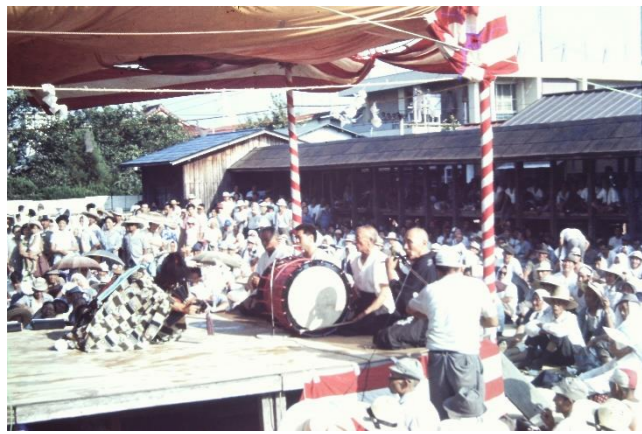
1 恩俗神楽(奥州市)「宝剣納め」