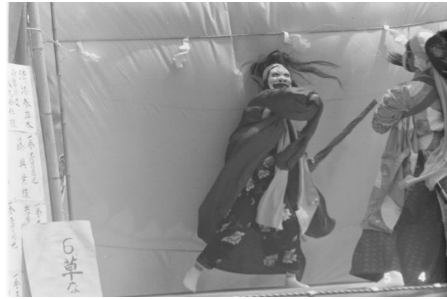
9 本郷神楽「宝剣納め」