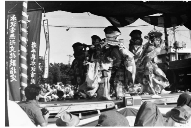
7 北下幡神楽(奥州市)「鳥舞」