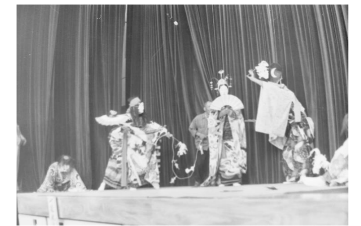
16 熊田倉神楽「天の岩戸開き」