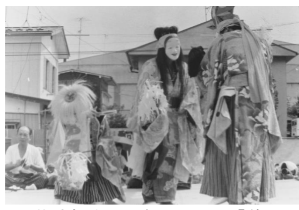
10 芋塚神楽(宮城県栗原市)「曾我兄弟、養育依頼」