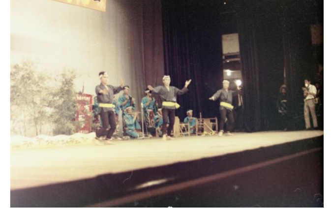
4 日和田田植踊(山形県寒河江市)