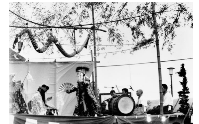
11 赤谷神楽(登米市)「八雲舞」