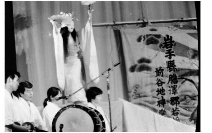
8 前谷地神楽(奥州市)