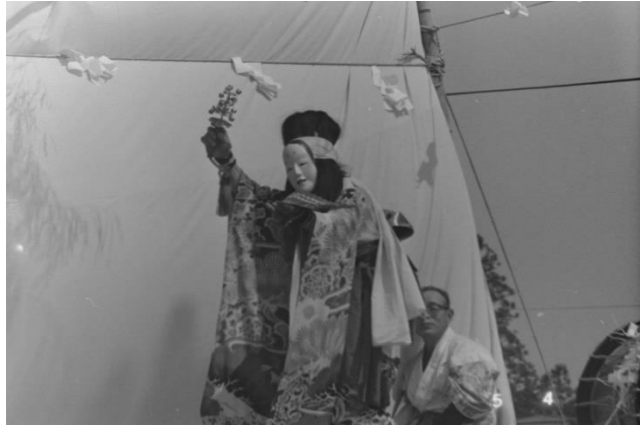
1 大門神楽「宝剣納め」