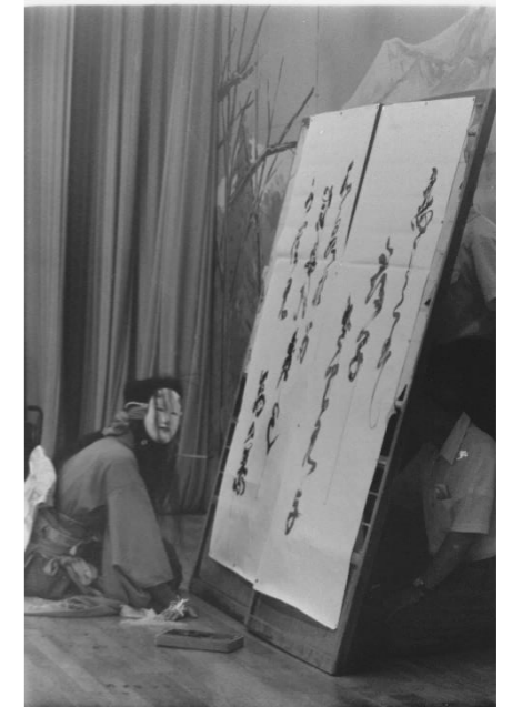
12 前谷地神楽(奥州市)「葛の葉」