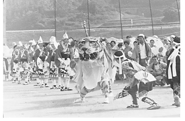
13 根白虎舞(大船渡市)