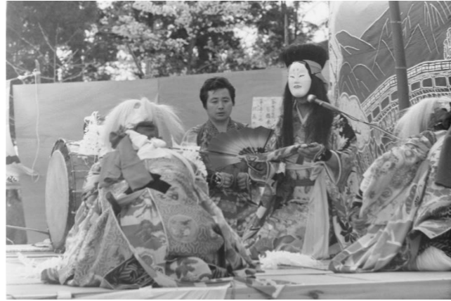
2 中野神楽(栗駒市)「小袖曾我」