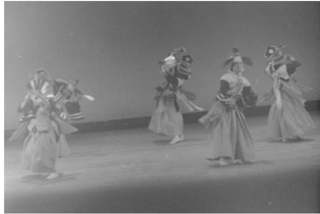
2 岩手県青年大会 昭和58年7月30,31日 於 和賀