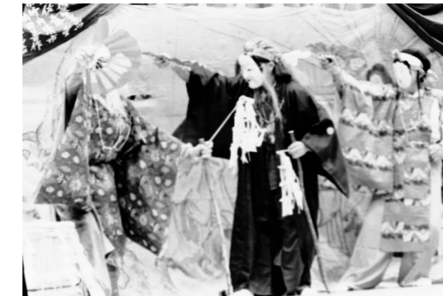
11 本楯神代神楽(山形県酒田市)