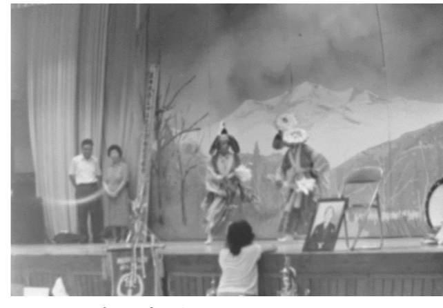
11 鳥沢神楽(栗原市)か