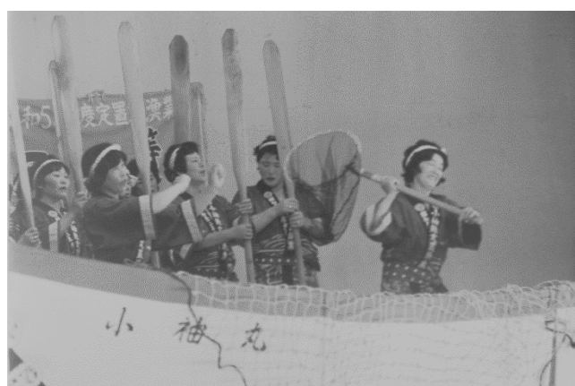
12 小袖漁撈唄か(久慈市)