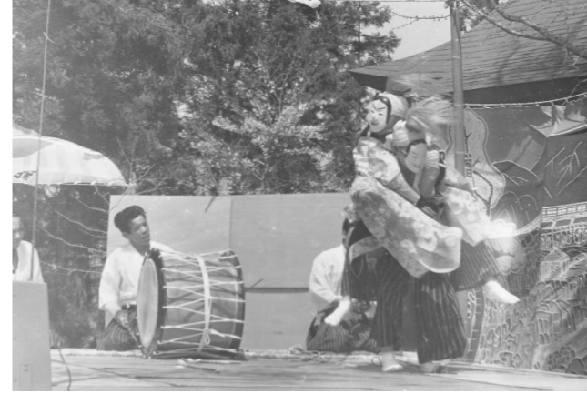
3 白浜神楽「屋嶋合戦」