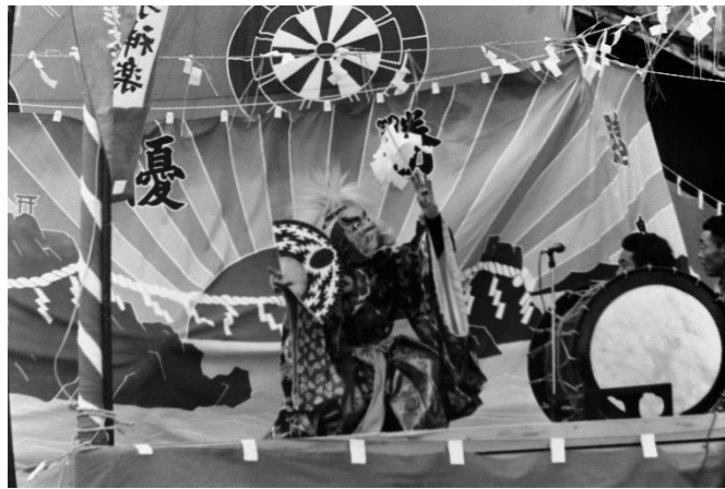
5 十文字神楽(奥州市)「宝剣納め」