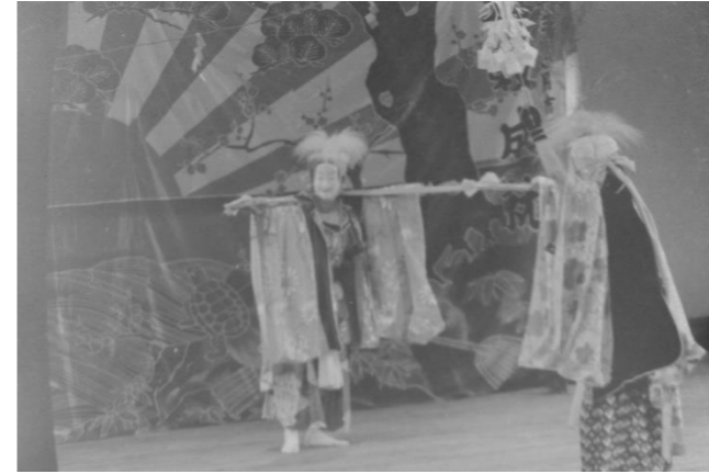
3 狼ヶ志田神楽(奥州市)