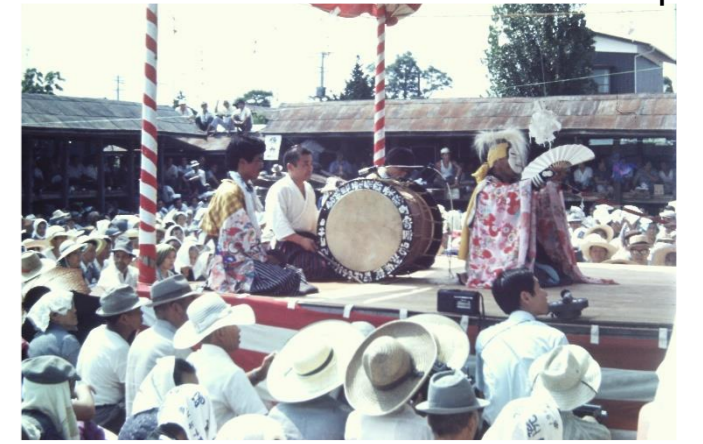
4 沼倉神楽(栗原市)「秀衡、対面」