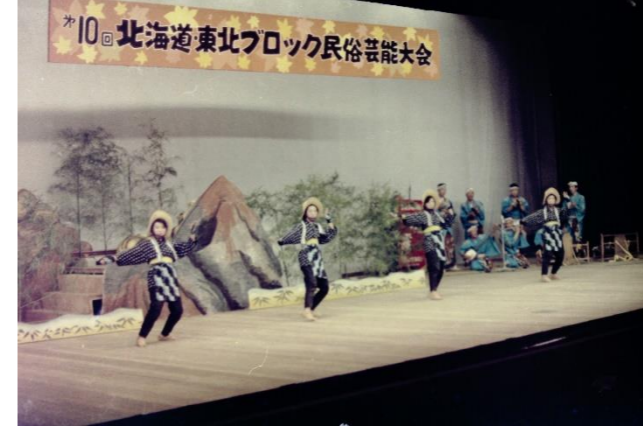
3 南部虎舞 上斗賀芸能保存会(青森県南部町)