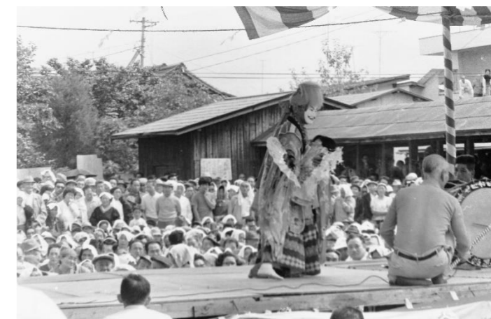
15 中野神楽(栗原市)「葛の葉子別れ」