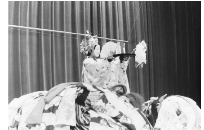
12 真山神楽(宮城県大崎市)