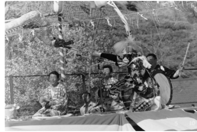
3 十文字神楽(奥州市)「大蛇退治」