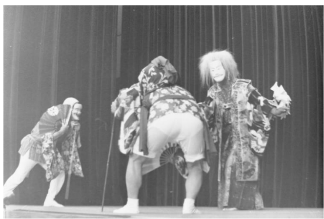
13 曾慶神楽「高山掃部長者興亡記」