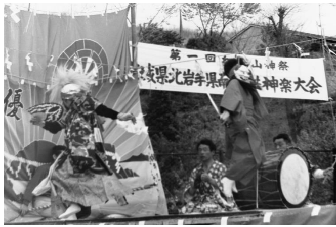
1 十文字神楽(奥州市)「宝剣納め」