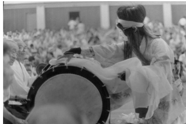
2 恩俗神楽(奥州市)「羽衣」