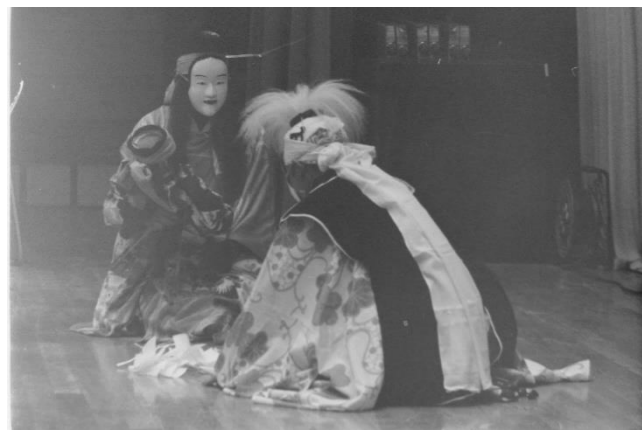
13 狼ヶ志田神楽(奥州市)「葛の葉子別れ」