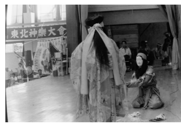
15 片子沢神楽(栗原市)「松浦小夜姫」