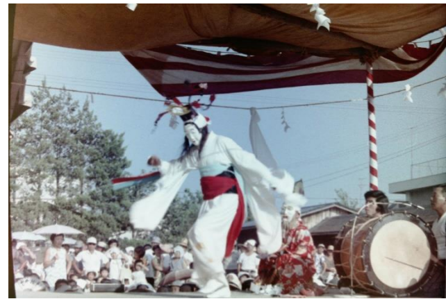
5 保柳神楽(大崎市)「鐘巻」