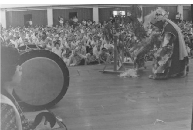
14 一関夫婦神楽「羽衣」