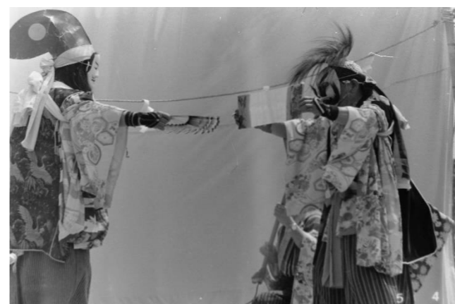
11 鶯沢神楽(栗原市)「安宅の関」