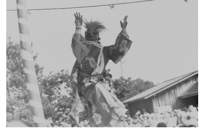
8 鳥沢神楽(栗原市)「山ノ神舞」