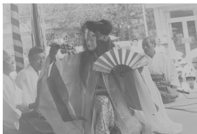
12 前谷地神楽(奥州市)