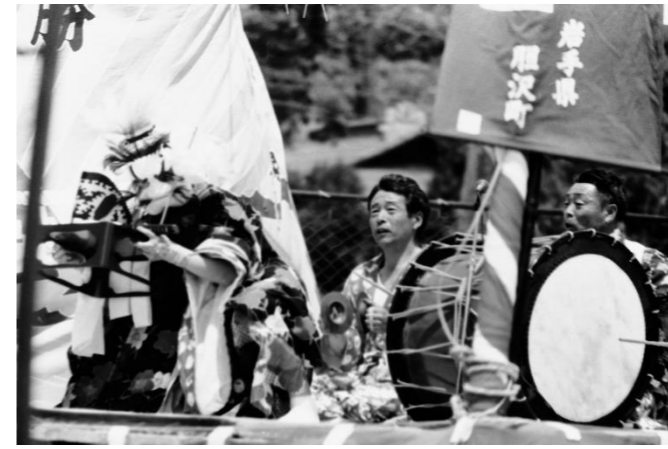
3 十文字神楽(奥州市)「宝剣納め」