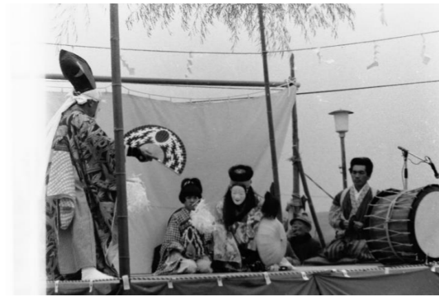
9 猿飛来神楽(栗原市)「曾我兄弟、養育依頼」 10