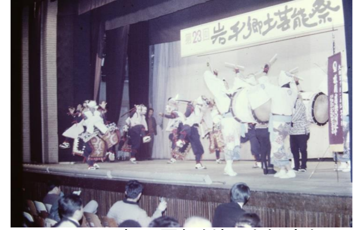
4 板用肩怒剣舞(大船渡市)