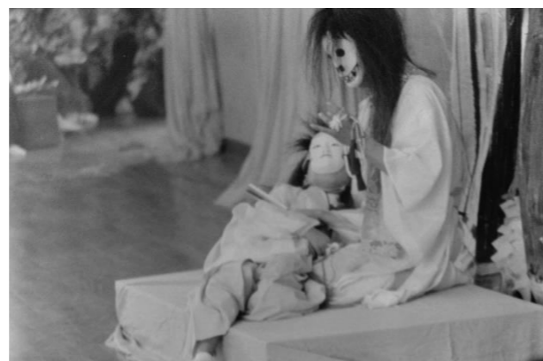
5 前谷地神楽(奥州市)