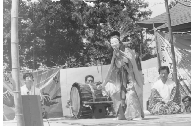
1 大平神楽(栗駒市)「宝剣納め」