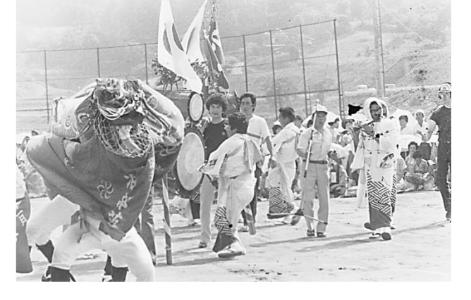
16 泊権現舞(大船渡市)