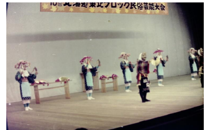
8 日和田田植踊(山形県寒河江市)