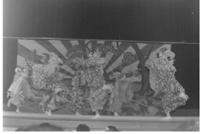
12 狼ヶ志田神楽(奥州市)