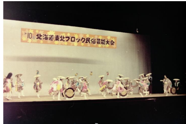
2 常州下御供佐々楽(道地ささら)(秋田県能代市)