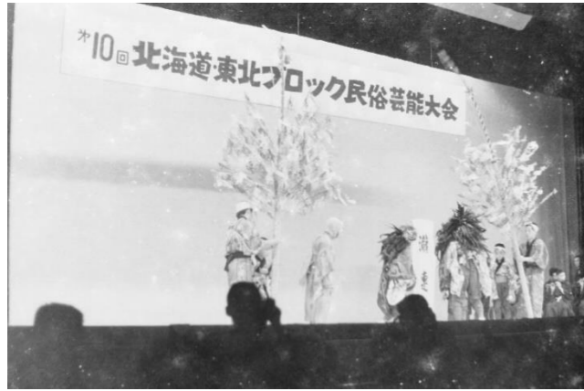
1 小浜長折三匹獅子舞(福島県二本松市)