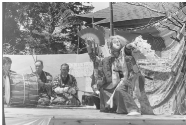
6 下大籠神楽「牛若丸、奥州下り」