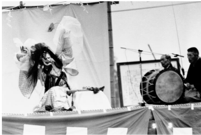
12 前谷地神楽(奥州市)「悪鬼宝剣盗り」