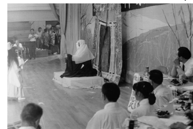
4 前谷地神楽(奥州市)「法童丸、父の魂魄と対面」