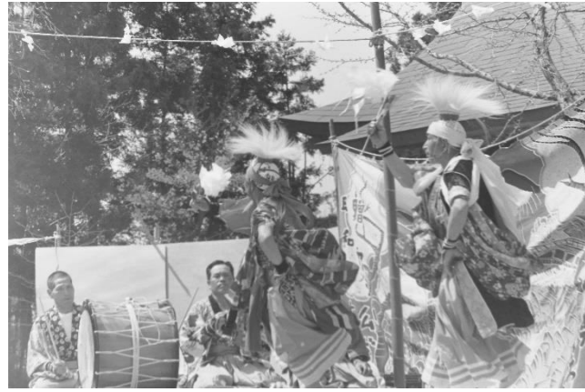
5 達古袋神楽「岩戸入」