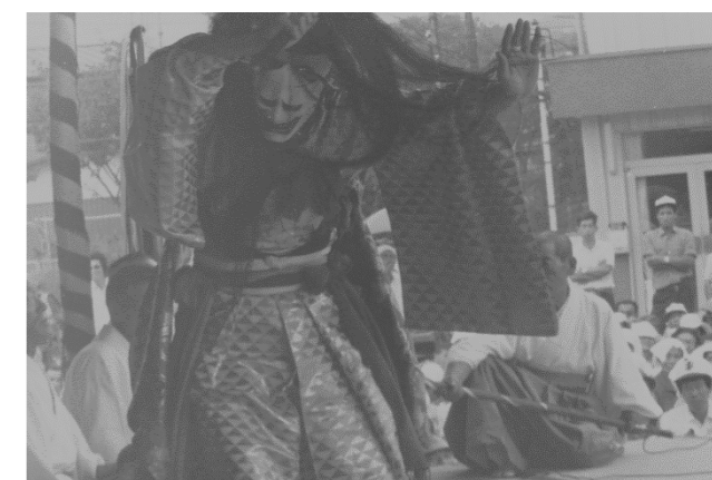
11 前谷地神楽(奥州市)