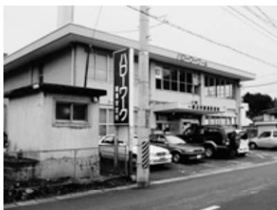
求職者が殺到するハローワーク

への対応は難しい。 義援金は今後、被災者の生活再建と被災地の復興に活用すべきと考えている。