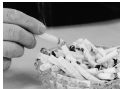
家族・社会の為に健康を考えよう

喫煙や飲酒が、健康に及ぼす影響を市民に理解していただくために、健康相談や健康教育の中で、指導をおこなっている。生活習慣病の予防におい