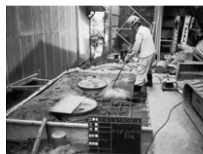
普及促進の合併浄化槽

の浄化槽の処分等から、個人設置型に統一しようとするもの。この考え方を示し、ご理解を頂きながら進めたい。