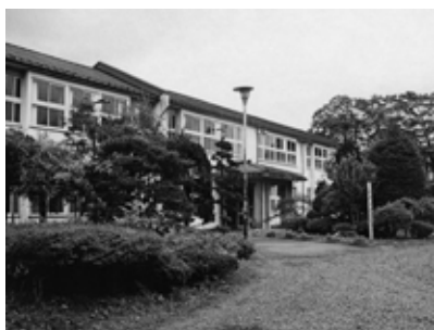
改築が待たれる中里中学校校舎

建て建築され7年の歳月を経て現在に至っている。改築すべきでは。 答弁 中里中学校の敷地が地すべり防止区域内にあること、北側地域も地すべりの関係から断念した経緯がある。校舍改築の順序の考え方は、最近少子化の傾向等のなか、より良い環境の確保のため昨年、通学区域調整審議会を開催し「学校規模の適正化の基本的な考え方」について諮問した所、答申をいただいたところで