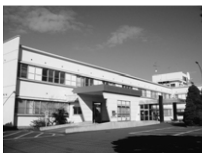
花泉診療センター

生活苦の状況で、国保税を滞納した場合等は、資格証明書の発行をすべきではないと考えるがどうか。乳幼児、就学児童のいる家庭に対しては、資格証明書の発行を行うべきではないと考えるがどうか。