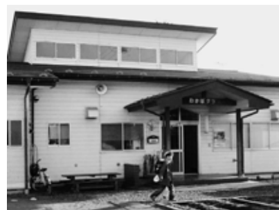
対策が急がれるわかば児童クラブ

ジェクトチームを組織し地元住民の意向も踏まえての案が示されて2年になる。その後どうなっているのか。 教育委員会・農業委員会を、支所に移し地域の活性化を図る考えは無いか。 答弁 現在、閉校校舎等の活用方針について企画振興部を中心に庁内で検討を重ねており、大東地域における廃校となった5つの小学校の利活用案もその中で方向づけたい。 教育委員会等の支所への