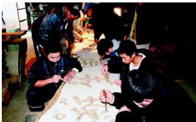
看板の手彫りに励む子供達