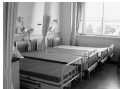
花泉診療センター

現在は花泉診療センターの無床化に反対の要望を行っているところであり、要望に対する的確な答えがない、返事を待ちたい。更