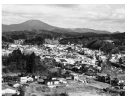
合併効果が期待される周辺部市街地

インターネットの利用と共に講習会や、情報提供を関係機関と連携し、指導の充実に引き続き努める。