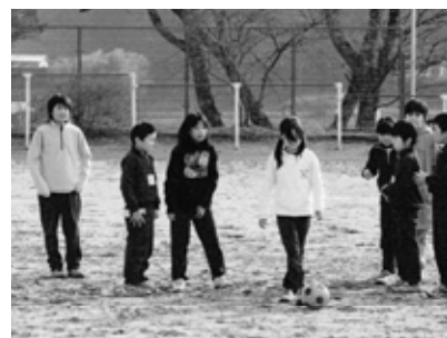
友情を育む子供達

ける、いじめ、暴力行為、不登校の実態と対応は。 答弁 いじめ、9年度小学校6件、中学校4件、0年度は減少傾向にある。暴力行為は9年度中学校で4件、本年は1件。不登校は9年度小学校4名、中学校9名、0年度小学校2名、中学校3名、学校での取り組みのなかでいじめ対策ではアンケート調査や日常的な観察、定期的調査実施、問題の早期発見、早期解決を図っていく。不登校に対