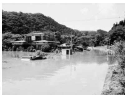
昨年増水した舞川番台地区