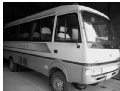
川崎の患者輸送バス

プロジェクトチームで検討している。利用者の視点で、サービス量、利用者負担の均衡等を考えながら検討している。