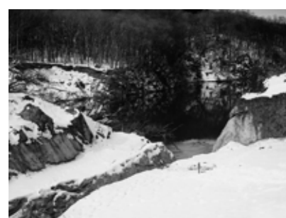
河道付替が待たれるせき止め湖

めにも無料健診を4回に拡充すべきでは。 答弁 国の動向を踏まえながら拡充する方向で検討していく。