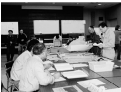
地震直後の一関市災害対策本部

要介護者に対する対応が求められるので、今後の計画については県の指導を受けながら対策を講じる。