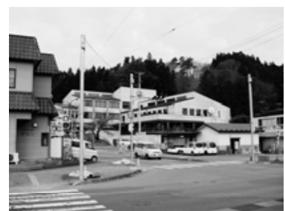
地域経営の要 東山総合支所

その他の一関地域の最後の給食センターは5年度を目標に整備し、市内の小中学校は全てセンターからの供給となる。