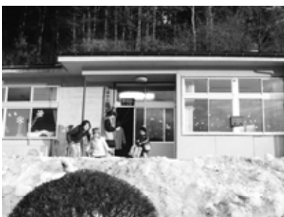
元気に通う丑石児童館の子供たち

答弁 未就学児の保護者、自治会長等を対象にそれぞれ懇談会を開催してきた。両地区とも大原保育園や興田保育園を利用する家庭が