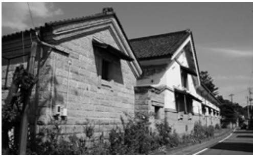
千厩酒のくら交流館

主なものとして新たに指定したのは、各児童クラブをクラブの運営委員会へ。真滝児童館、千厩農村労働福祉センターを社会福祉協議会へ。再指定したのは、各集会施設を地元の自治会へ。アストロ・ロマン大東を室根総合開発(株)へ。花と泉の公園を花泉観光開発(株)へ。千厩酒のくら交流施設