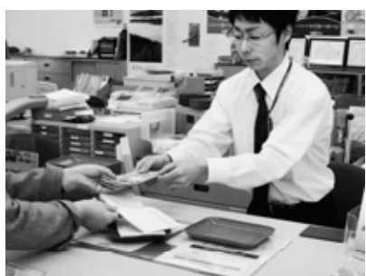
自主納税を心がけましょう

質問 学校給食センターの整備計画及びミルク給食校の完全給食化を図れないか。 答弁 平成1年度はミルク給食である一関中、一関東中、桜町中、舞川中の4校と川崎地域の小中学校と滝沢小、弥栄小をエリアとする学校給食センターを整備する。 3年度は千厩、室根地域の小中学校の給食センター、