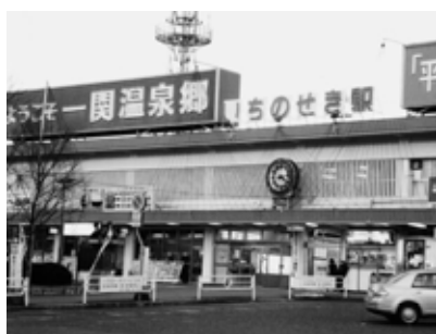
開発構想が示された一ノ関駅