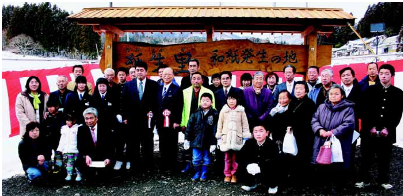
市長と「TABASHINE山おこし村」の会員たち (東山地域)

発行/岩手県一関市議会 住所/一関市竹山町7番2号 編集/議会報編集特別委員会 電話/0191-21-8604 FAX/0191-26-5556