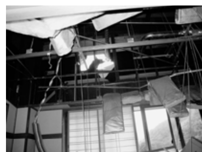
壊滅的被害を受けた真湯山荘室内

答弁 コテージ0棟については来春再開したい。真湯・祭時地区の観光振興を図るため、仮称真湯・祭時地区基本構想を進めている。現在、農林施設ではあるが、今後は観光施設としての位置づけを検討している。ス