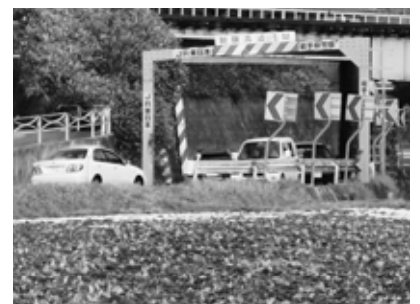
国道284号線狭湍箇所(大里ガード)

物集団回収事業や分別の徹底による不燃ごみの減少が要因である。 今後もこれらの制度を実施し推進に努めていく。