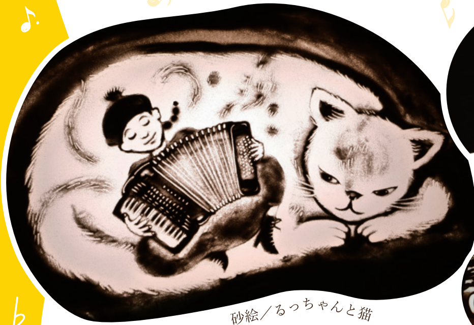
砂絵/るっちゃんと猫