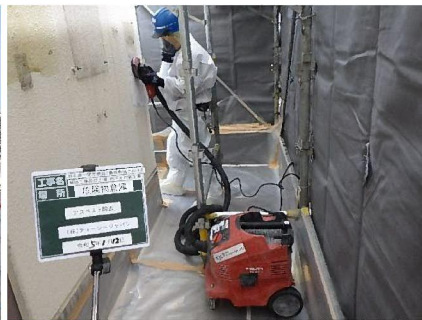
【アスベスト飛散防止対策状況】