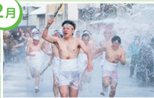
一関市・大東大原水かけ祭り