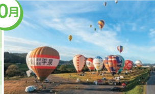
一関・平泉バルーンフェスティバル