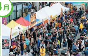
全国もちフェスティバル