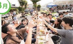
全国地ビールフェスティバル in 一関