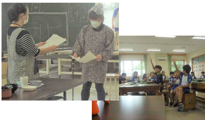
【小学生対象サポーター養成講座の様子】

一関市と平泉町では小・中高生を対象とした認知症サポーター養成講座を開催しキッズサポーターが毎年誕生しています。