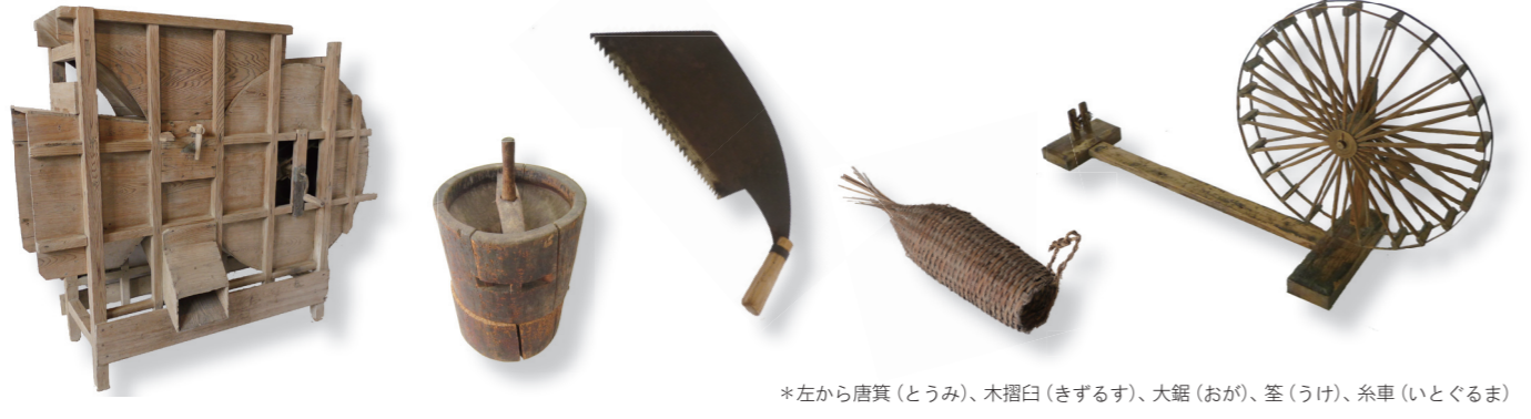
*左から唐箕（とうみ）、木摺臼（きずるす）、大鋸（おが）、釜（うけ）、糸車（いとぐるま）