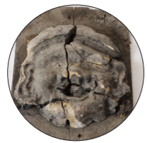
大黒様の面相のカマドガミ（川崎町）