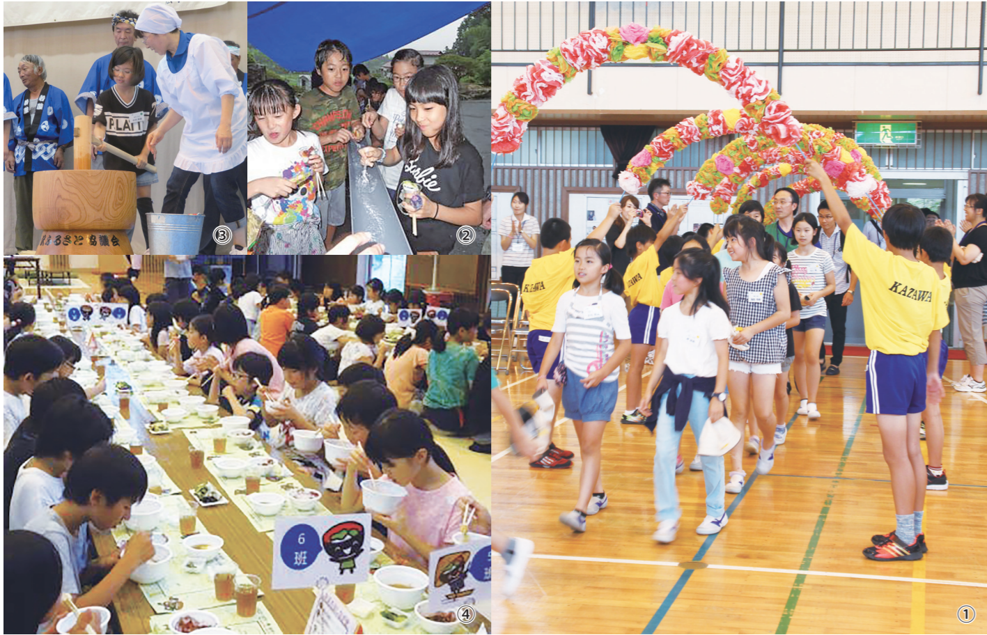
①金沢小児童がアーチを作って市谷小児童らを歓迎/②ホームステイ先で流しそうめんを楽しむ児童たち/③金沢ふるさと協議会の皆さんの指導を受け餅つきを体験する児童/④つきたての餅(あんこもち、しょうがもち、雑煮)をみんなでいただいた

I-Style Ichinoseki City Public Relations Magazine August 2017