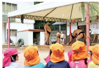
大相撲東関部屋夏合宿中の朝稽古を応援する松川保育園児