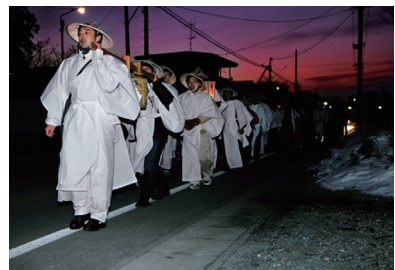
くんだ若水を奈良坂峠を越え、平泉まで徒歩で届ける参加者

松川市民センターは昭和53年9月、現在の場所に移転新築されました。地域住民の活動の場、学習の場、子供たちの遊びの場として、多くの人に利用されています。 当センターを拠点とした祭りが二つあります。 一つは、大相撲東関部屋フェスティバルです。毎年お盆前のおよそ一週間、当センターを会場に力士たち10数人が合宿します。合宿の期間中は毎日、朝稽古が見学できます。また、合宿の終盤に行われるフェスティバルでは、力士との触れ