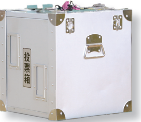
選挙管理委員会事務局 2111

◇応募期間：7月3日⑧～14日⑨ ◇申し込み：①市ホームページの選挙管理委員会のページの入力フォームから申し込み②同ページの投票立会人申込票をダウンロードし、必要事項を記入して、選挙管理委員会に持参または郵送する