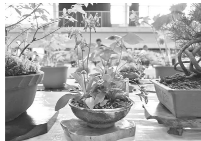
丹精込めて育てられた山野草