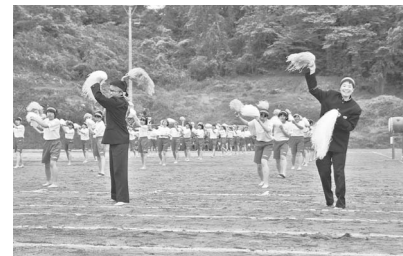
雨にも負けず全力で応援合戦