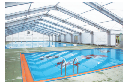
リニューアルされたプール

東山B&G海洋センターが6月17日にリニューアルオープンします。海洋センターは、設置されてから約30年経過し、施設全体の老朽化が進んだことから、改修を行ってきました。 プールサイドの改修やトイレの洋式化などを行い、安全性や利便性が向上しました。また、照明器具も更新し、とても明るいプールとなっていますので多くの人のご利用をお待ちしております。