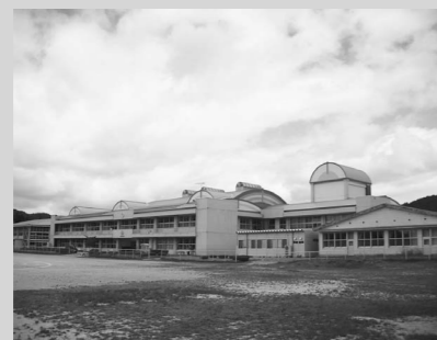
現在の東山小学校

平成26年4月に東山地域の3つの小学校が統合しました。新校舎の建設場所については、「一関市立東山小学校新校舎建設候補地検討委員会」から「現・東山小学校敷地」とする提言書が東山支所長に提出されました。これを受け、5月30日に開かれた、教育委員会定例会において協議され、「現・東山小学校敷地」と決定しました。