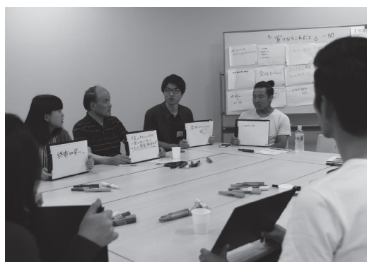
一関に来て感じることにについて語り合う参加者ら

20年度から28年度まで一関市博物館が実施した骨寺村荘園遺跡の調査研究の集大成です。論考編、資料編、史料編の3部構成で、博物館員らの研究論文や骨寺村荘園遺跡の空撮写真や陸奥国骨寺村絵図などが掲載されています。骨寺村の歴史を知ることができるほか、農村の原風景を感じることができる1冊です。