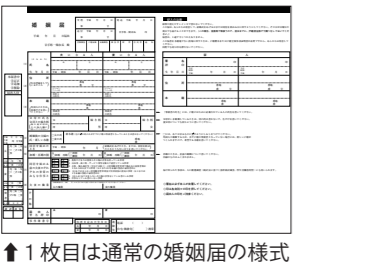
↑1枚目は通常の婚姻届の様式 ↓2枚目は夫婦の記念用（複写式）

オリジナル①なのはなフレーム ▶「快活な愛」の花言葉を持つなのはな。市の花でもあるなのはなが、2人の未来を彩ります