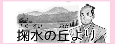
芦東山記念館 ☎ 3861

防災行政無線(屋外広報マスト)で放送された内容は、電話応答装置(テレガイド)で確認できます。通話料無料 ☎0800-800-3174 または有料 ☎215008(携帯電話やPHSで通じない場合) ☎消防本部消防課 ☎210119