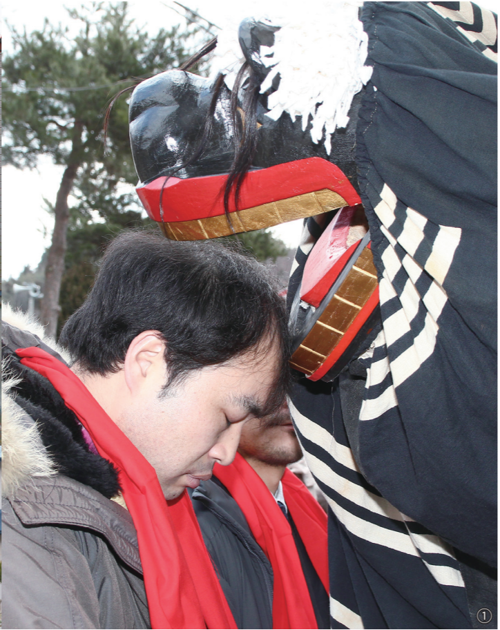
①権現様に頭をかんで厄払いをしてもらう42歳の祝年者②権現舞を披露する峠山伏神楽保存会の皆さんと祝年者③厄払いの儀式を見守る祝年の同級生の皆さん④獅子に驚き半泣きする幼児