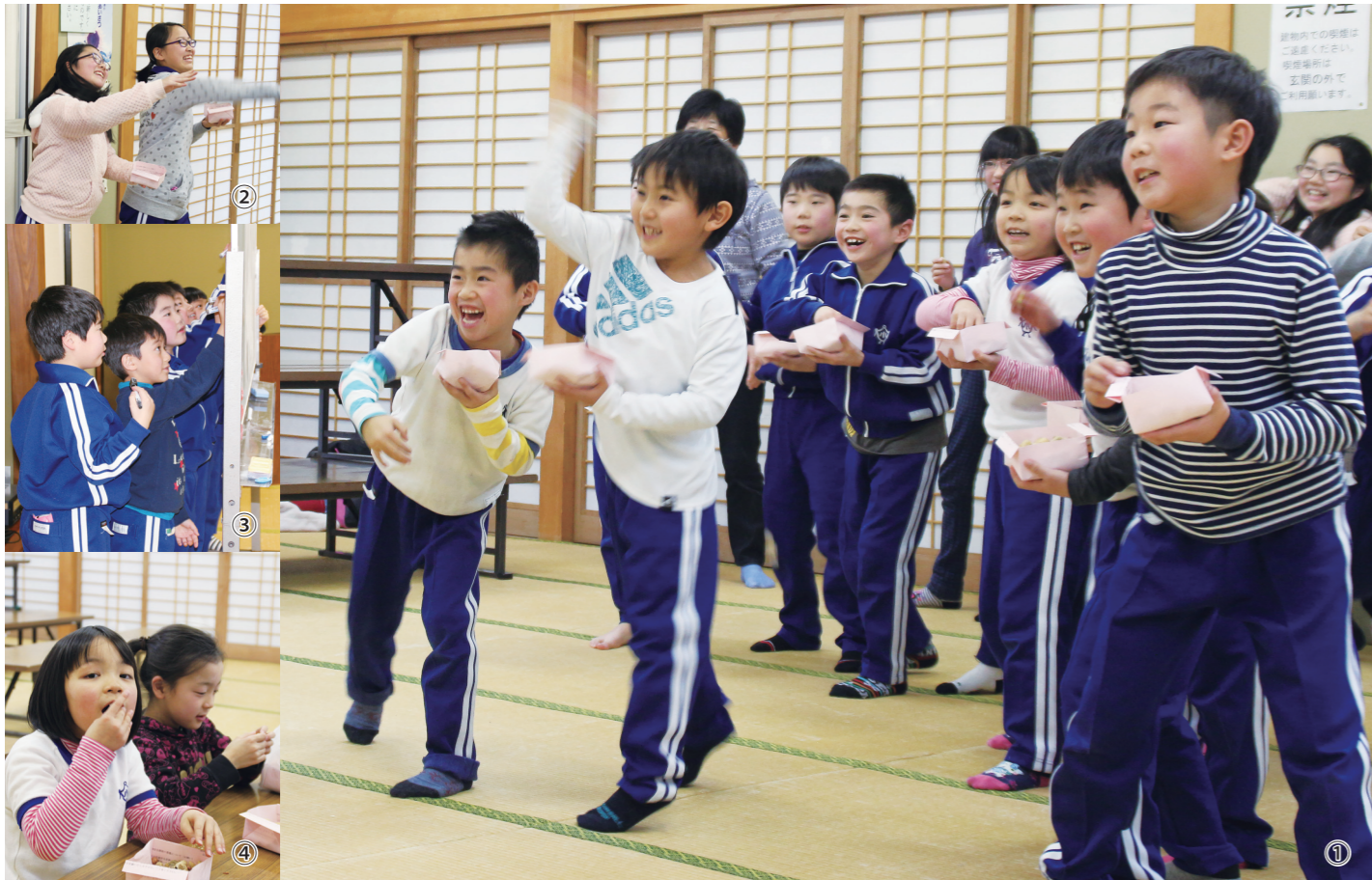
①②力いっぱい豆を投げる児童たち/③ボードに目標などを書く児童/④豆をおいしそうに食べる児童

Ichinoseki City Public Relations Magazine 2 February 2017