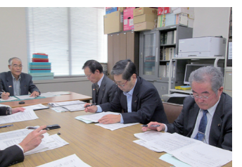
市選挙管理委員会では、投票所に関するほか、選挙人名簿や開票のことなど、選挙に関する事項を協議しています