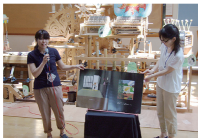
音楽水車の前で読み聞かせをする川崎図書館の職員