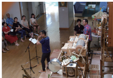
音楽水車前で行われたコンサート。利用者は優しい音色に聞き入っていた

川崎市民センターは川崎支所からほど近い、北上川のほとりにあります。会議室や、230人収容できるホールがあり、生涯学習、芸術文化の拠点として多くの住民に利用されています。川崎図書館と同じ建物内にあるので本を借りてきた親子連れも多く訪れることが特徴です。