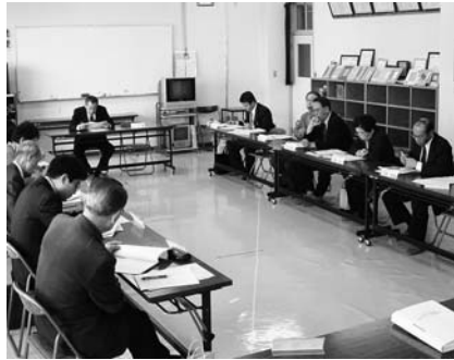
「健康いちのせき21計画」策定委員会

市は3月29日、市民一人一人が自らの健康づくり実践の支援や地域で健康づくりを推進する「健康づくりサポーター」の行動指針を示す「健康いちのせき21計画」を策定しました。