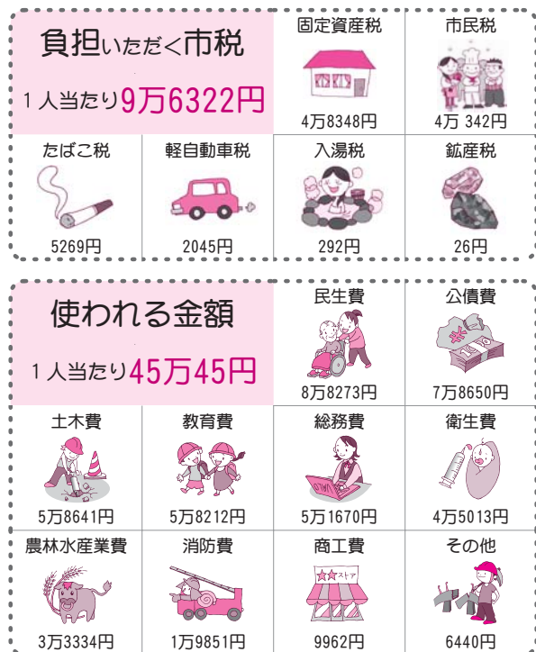
図3 ■市民1人当たりで見た一般会計の予算