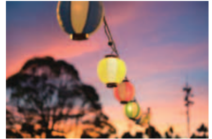
大人も子供も祭りばやしに心が躍る