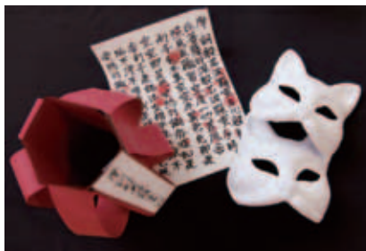
作り込んだ小道具が怪談を盛り上げる

◇日時…8月21日⑩ 11:00～11:20、 ⑪ 11:30～11:50 ◇内容…①ちょっとこわい(未就学児向け)、②すごくこわい(小学生向け) ◇場所…川崎図書館 ◇費用…無料 ⑩川崎図書館 ☎④4123