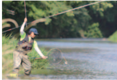
砂鉄川では9月中旬までアユ釣りが楽しめる