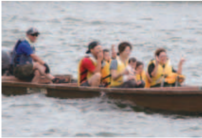
ボートやカヌーで川の流れをじかに感じられる