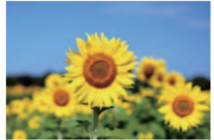
ヒマワリの名は太陽を追うように動くことに由来