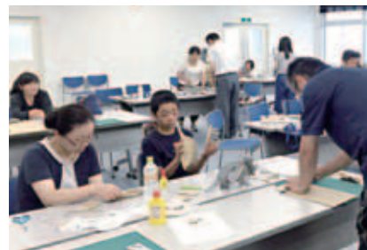
体験の一番人気はダンボールアート

◇日時・内容…7月30日④・ 聖ポル、8月2日⑧・ 飛行機と、8月4日⑨・ リサイクル、8月6日⑩・ ペットボトル、8月8日⑪・ 空き缶*いずれも9:00～ ◇場所…一関清掃センター ◇費用…無料 ⑩一関清掃センター ☎②1257