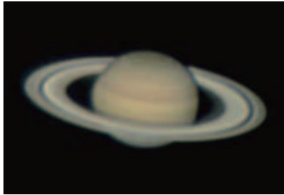
室根町折壁の「天文台ひろ」で撮影した土星