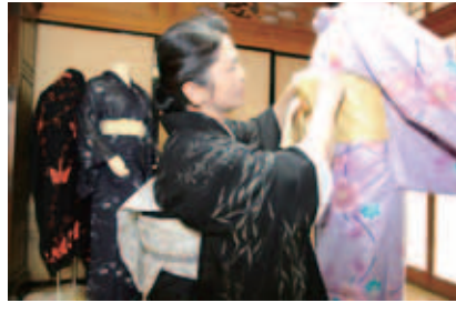
浴衣の着付けにかかる時間は1人30分程度