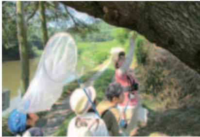
毎年、どんな動植物がいるのかを調査している