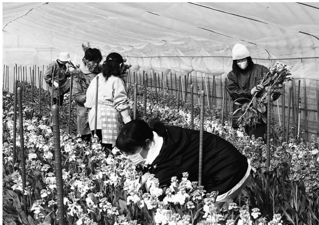
ちょうどいい時期に開花させるにはハウスの温度管理や換気が大切。出荷を迎えたストックを収穫するメンバー

「花・咲かせ隊」は平成17年4月、川崎地域の30代から60代の女性6人で結成した切り花栽培のグループ。メンバーのうち4人は、15年にオープンした道の駅「かわさき」を運営している「ドンと市かわさき協同組合」花班メンバーで、夏場には小菊などをそれぞれ栽培し出荷してい