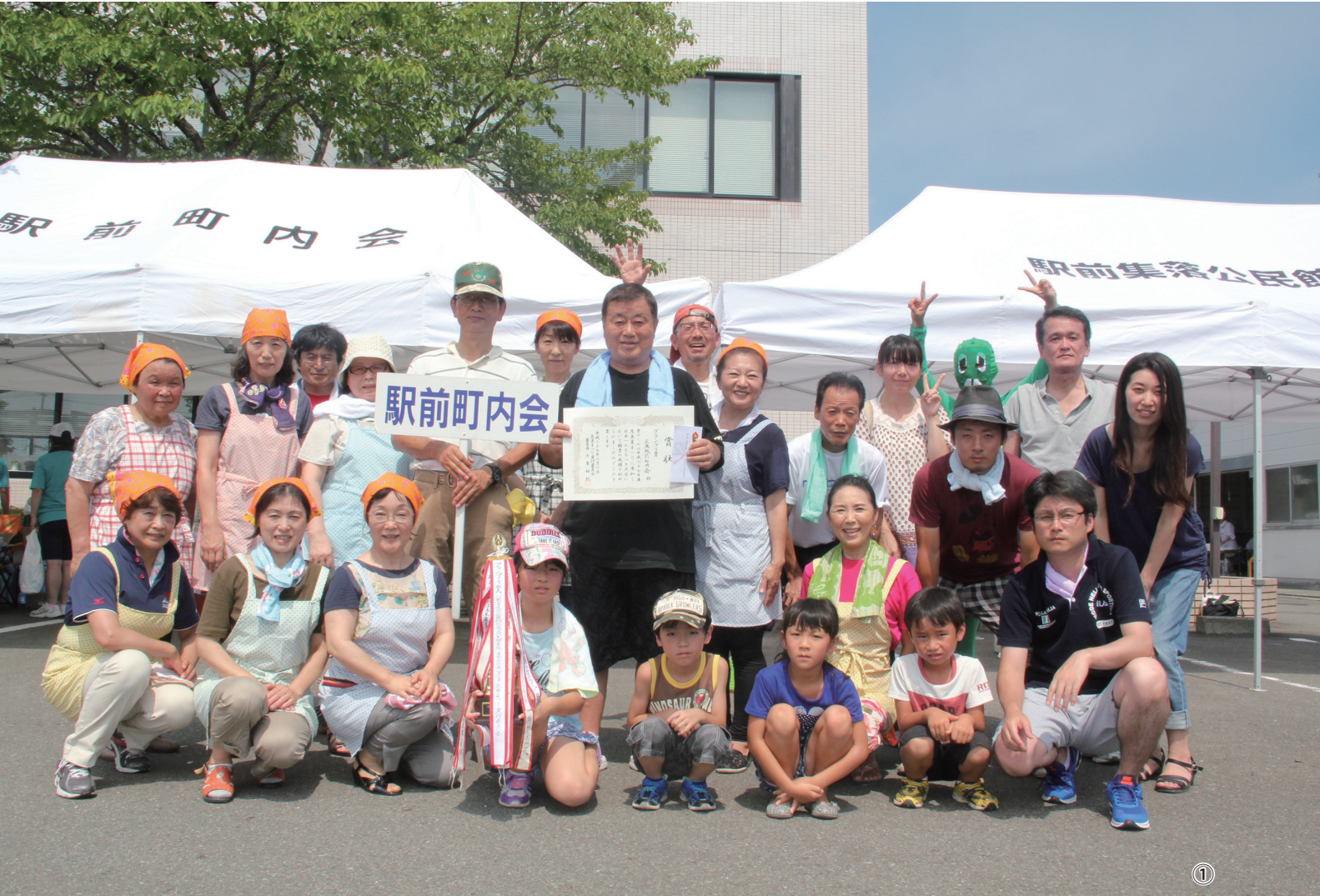
①グランプリ賞に輝いた花泉駅前町内会の皆さん ②餅をつく老松みどりの郷協議会の皆さん ③花泉高校では日本一小さなもちつきを披露

編集後記 ▶あんなに暑かった夏はどこへ?肌寒い日が続いています。体調管理には気を付けましょう。▶21日には花と泉の公園で「花泉フェスタ&消防祭」を開催します。ご家族や友人とぜひご来場ください。(岩淵)