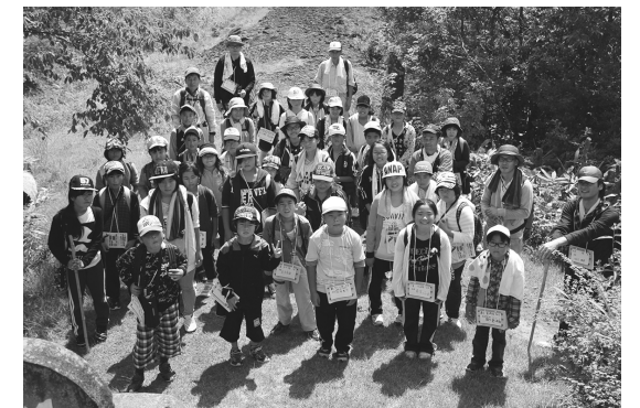
国見山の山頂で記念撮影

子供たちはこの3日間でたくさんの友達をつくり、いろいろな体験をし、たくさんのことを学びました。この合宿で少し成長したようです。