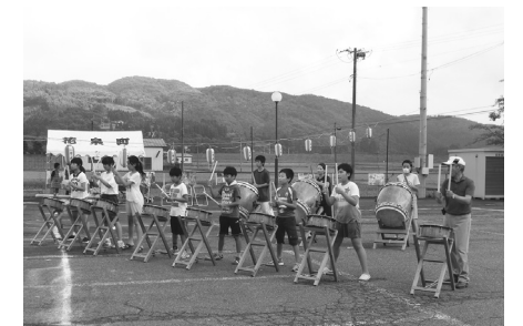
日形太鼓を演奏する子供たち(日形)