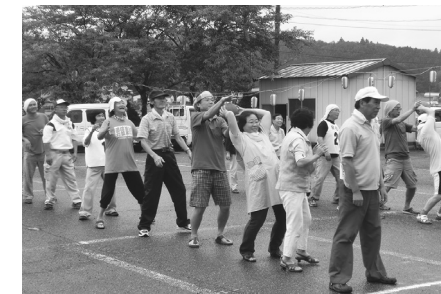
ボール送りをを行う参加者(日形)