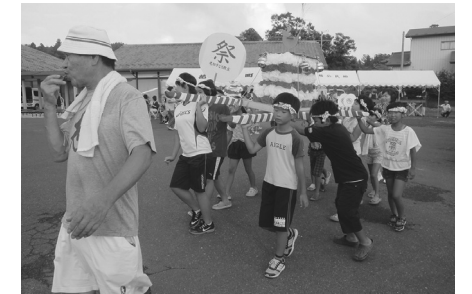
みこしをかつぐ子供たち(老松)