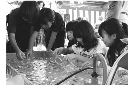
縁日を楽しむ子供たち(涌津)

日形地区は、日形市民センターを会場に2部構成で実施。第1部の運動祭りでは3組に分かれて競技を楽しみました。第2部は夕涼み祭りを実施。日形太鼓や盆踊り、カラオケなどで盛り上がりしました。