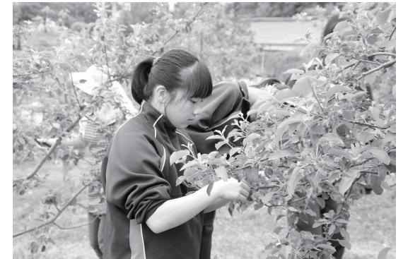
一生懸命リンゴの摘果を行う女子生徒

最終日は、受け入れ農家とともに見頃を迎えたばたん園を見学。ボタンをバックに写真を撮るなどして楽しんでいました。