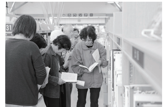
興味のある本を手にとって見ている参加者

花泉図書館では随時見学を受け付けています。見学を希望される団体は花泉図書館☎4939まで。