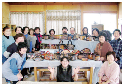
一閑張りは、竹や木で組んだ骨組みに和紙を張り重ねて形を作ります