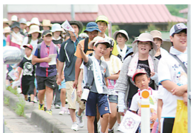
参加者全員が、最後まで元気に歩いた「はぎしょうの里元気ウォーキング」

萩荘市民センターの前身、萩荘公民館は、昭和25年旧萩荘村役場内に設置されました。昭和54年に現在の建物に改築。平成23年3月の東日本大震災で大きな被害を受けながらも、地域の生涯学習・地域活動の拠点施設としての役割を担ってきました。