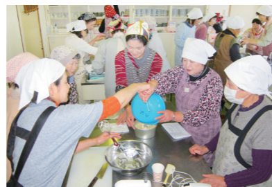
女性生活学級で「シンフォンケーキ作り」に挑戦