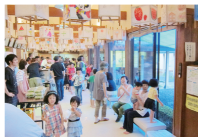
老松小児童に行燈を作ってもらった「老松地区夏祭り」

老松市民センターに変わる旧老松公民館。当初、昭和30年の町村合併で旧老松村役場に併設されました。その後、旧老松中学校校舎に移転。昭和63年、現在の場所に移転新築されました。少年教育では、年間を通して「放課後子ども教室」や昔からのしきたりを学ぶ「おらほのしきたり事業」を開催。女性教育では、自家用農産物の加工食品づくりとして梅干づくりや当館の「むろ」で麴づくり教室を開きました。高齢者教育では、防犯、防災、交通安全、健康講