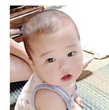
こがねもり・ひなた 25年11月27日生まれ 公直さん・若菜さん つかまり立ちができ るようになったね。歩 く日が楽しみだな☆