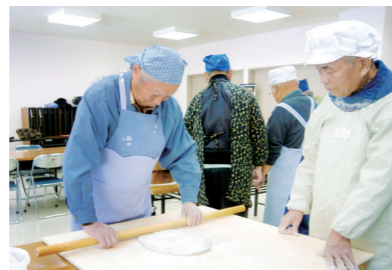
20年の歴史を持つ「男の料理教室」。手打ちそばをつくる参加者

松川公民館は、昭和33年11月に開館しました。現在の公民館は昭和53年に新築され、講堂も備えました。敷地内には土俵が設置されていて、毎年、大相撲東関部屋の合宿が行われています。また、隣地には県指定文化財木造来迎阿弥陀及び菩薩像（通称二十五菩薩像）が収蔵されています。地域の生涯学習、スポーツ・レクリエーション活動、交流の拠点として多くの住民に親しまれています。中でも講堂では、スポー