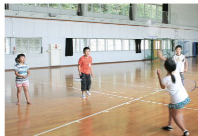
放課後子ども教室「ハッピースマイル松川」に参加する子供たち