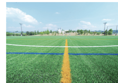
人工芝グラウンド