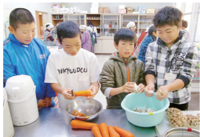
「油島っ子まつり」で豚汁の材料を準備する子どもたち