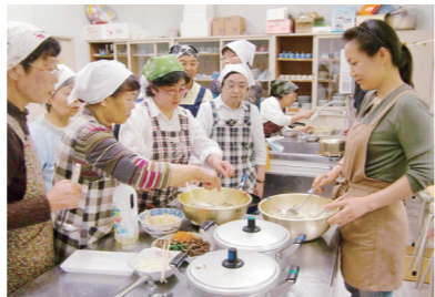
「旬を楽しむ会」では、四季折々の食材を使った料理を学んでいます

油島公民館は、市役所花泉支所から南南西に約3kmに位置します。建物は、1980年に現在の場所に移転新築し、生涯学習や交流の場として多くの住民に親しまれてきました。油島公民館の代表的な事業が「油島っ子まつり」。毎年11月の公民館まつりに併せて開いています。豚汁やパンなどを振る舞い、いろいろな遊びを体験してもらおうイベントです。各コーナーでは、小中学生がスタンプに加わり、地域の皆さんと触れ合いながら