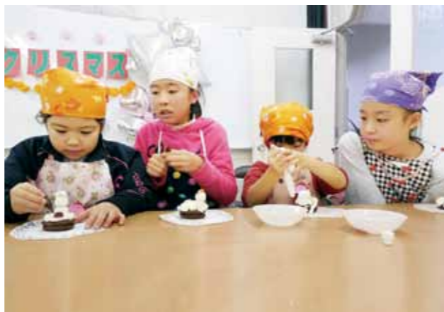
クリスマス会でカップケーキをデコレーションする子供たち

83年4月に開館した山目公民館は、市役所本庁から南に5分ほど歩いたところにあります。03年4月には隣接する一関勤労者体育センターが山目公民館体育館になり、多くの住民に利用されています。 昨年開館30周年を迎え、本年度は地区の皆さんで構成する実行委員会が「山目公民館創立30周年記念事業」を実施。記念誌の刊行や記念式典等の開催を通じて、30年の歩みを振り返るとともに、これからの公民館のあり方を考え、さらなる地区の発展に決意を新たにしたいところです。