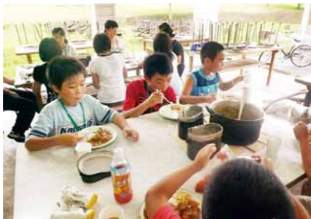
8月に行われた学びの土曜塾「夏休みキャンプ交流会」の様子

藤沢公民館は平成10年4月に、藤沢勤労者総合福祉センター「WORK・WORK Kふじさわ」を兼ねて開館。23年9月の合併で名称を「藤沢公民館」に改めました。併設する藤沢文化センター「縄文ホール」や藤沢図書館との複合施設です。