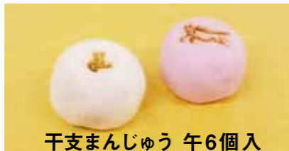
干支まんじゅう 午6個入