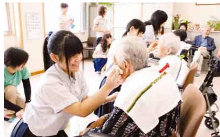
青年たちと高校生ボランティアが行った「敬老の日 お化粧プレゼント」