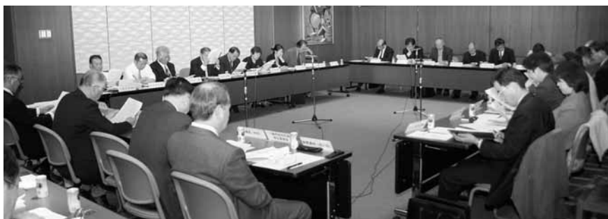
市長からの諮問を受け、審議をスタートさせた第1回総合計画審議会

※パブリック・コメント 行政機関が政策立案などを行う際にその案を公表し、広く市民・事業者などから意見や情報をいただく機会を設け、行政機関は、それらを考慮して最終的な意思決定を行うもの。