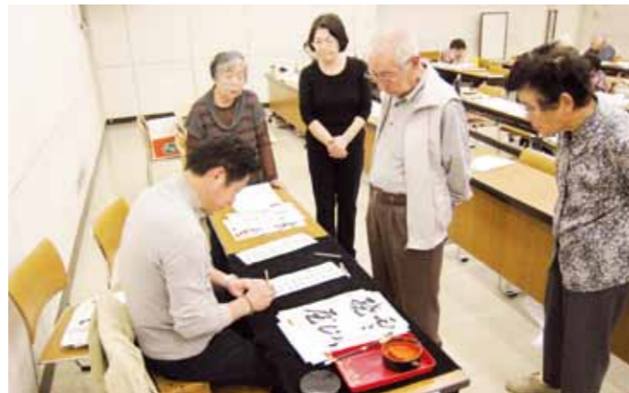
高齢者を対象にした「霜紅大学」

これまで大手町の一関文化センター内にあった一関公民館は今年4月1日、同日オープンした大町の市街地活性化センター「なのはなプラザ」に移転しました。