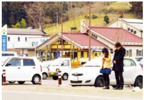
地震が発生した3月11日午後2時46分、市内各地で鎮魂の祈りが捧げられ、復興と再生を誓った(写真は川崎町の道の駅かわさき)

近い所が助ける「近助 きんじよ 」は、近所に生きる者の使命。希望ある未来を開くために、津波被災地に最も近い一関から復興の光を照らし続けよう。