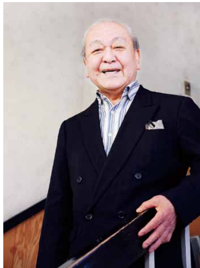
児童養護施設に30年間寿司を奉仕し続けた「すしおじちゃん」