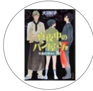
『真夜中のパン屋さん』 一午前0時のレシピ」 大沼紀子 著

本の帯に「あたたかい食卓がなくても、パンは誰にでも平等にいい。」都会の片隅に佇む、真夜中にしか開かないパン屋さん。夜な夜なやってくる一風変わったお客さまたちが、嵐のように巻き起こしていく事件とは？