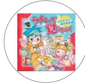
『うたって覚えよう』(音楽CD) WEEVE、チバナギサ他

大津波で大変な被害を受けた陸前高田市。美しい海岸にあった7万本の松の木の中で、たった1本生き残った木が歌っていた歌は…。「松の木の歌」をはじめ、作者の温かい気持ちが伝わる絵を添えた26のお話を収録。