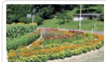
フラワーロード教育長賞 夏山自治会(東山)