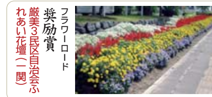
フラワーロード 奨励賞 厳美3区自治会ふれあい花壇(一関)