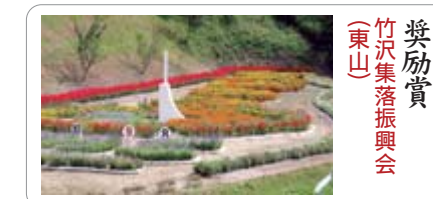
花壇 奨励賞 竹沢集落振興会 (東山)