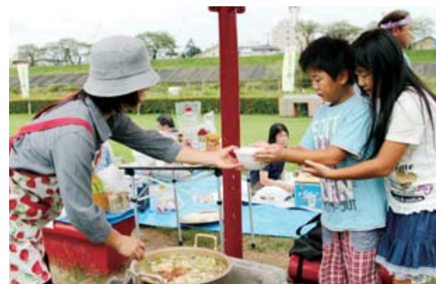
おいしいいものこ汁を召し上げ

同いものこ会は10月23日までの土曜、日曜・祝日に開催中。事前の電話1本で食材と調理器具がそろい、手軽に秋の味覚を楽しむことができます。