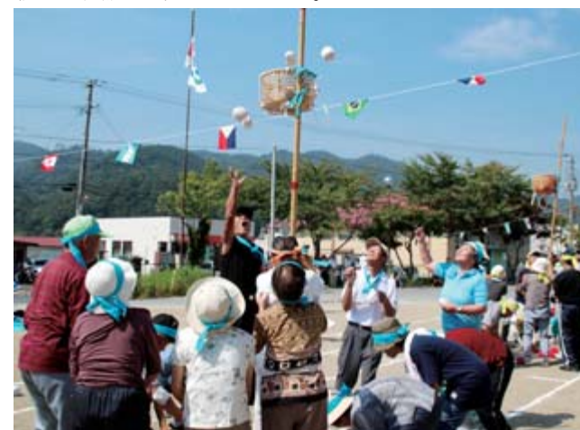
熱い戦いが繰り広げられた玉入れ競技「腰をのぼそう」