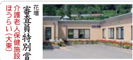
花壇 審査員特別賞 介護老人保健施設 ほうらい(大東)