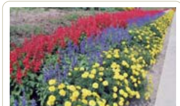
フラワーロード教育長賞 清田交通安全母の会愛妻班(千厩)