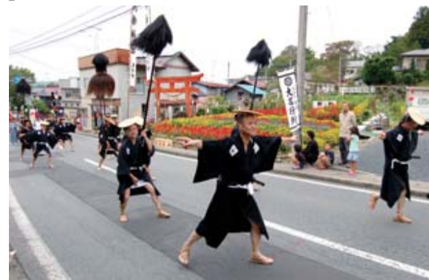
地元まつわる歴史絵巻を堂々と再現

金沢内沢の八幡宮が火災で焼失し、現在の地に遷宮された際に田村藩主名代とともに行列した故事に由来するこの行列は約250年間、毎年行われています。片足を上げて歩く独特のポーズと「セーハー、アウトセイヤー」の掛け声が沿道に詰めかけた観客を沸かせました。