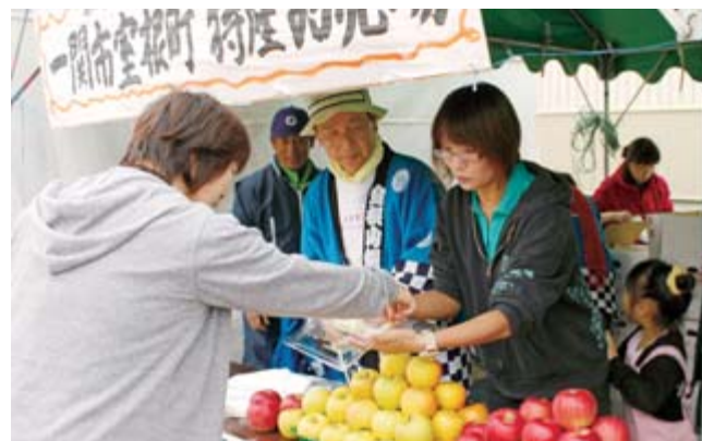
室根産の物産販売で交流を深める会員ら