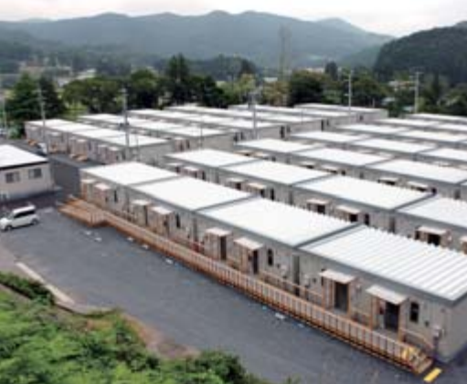
旧折壁小に建設された仮設住宅