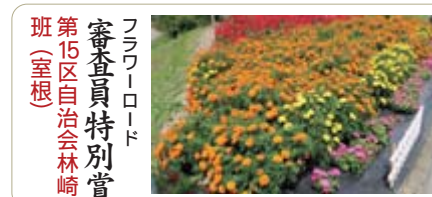
フラワーロード 審査員特別賞 第15区自治会林崎班(室根)