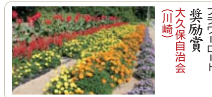
フラワーロード 奨励賞 大久保自治会 (川崎)