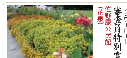
フラワーロード 審査員特別賞 佐野原公民館 (花泉)