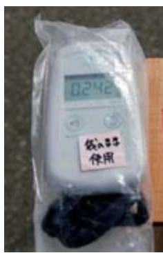
空間線量の測定機器

職員の派遣については、9月1日現在延べ4405人（消防団員含む）を派遣し各種支援を展開したほか、陸前高田市には、24年3月末まで継続して同市の業務を担当する職員11人を派遣しています。 被災者に対する支援は、9月1日現在延べ4405人（消防団員含む）を派遣し各種支援を展開したほか、陸前高田市には、24年3月末まで継続して同市の業務を担当する職員11人を派遣しています。