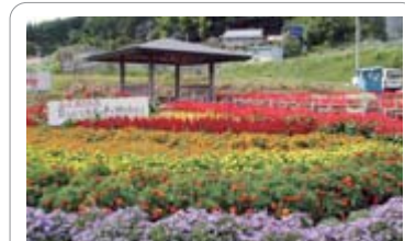
花壇 教育長賞 田茂木自治会(室根)