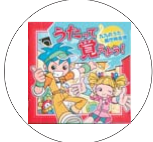
『うたって覚えよう』(音楽CD) WEEVE、チバナギサ他

大津波で大変な被害を受けた陸前高田市。美しい海岸にあった7万本の松の木の中で、たった1本生き残った木が歌っていた歌は…。「松の木の歌」をはじめ、作者の温かい気持ちが伝わる絵を添えた26のお話を収録。