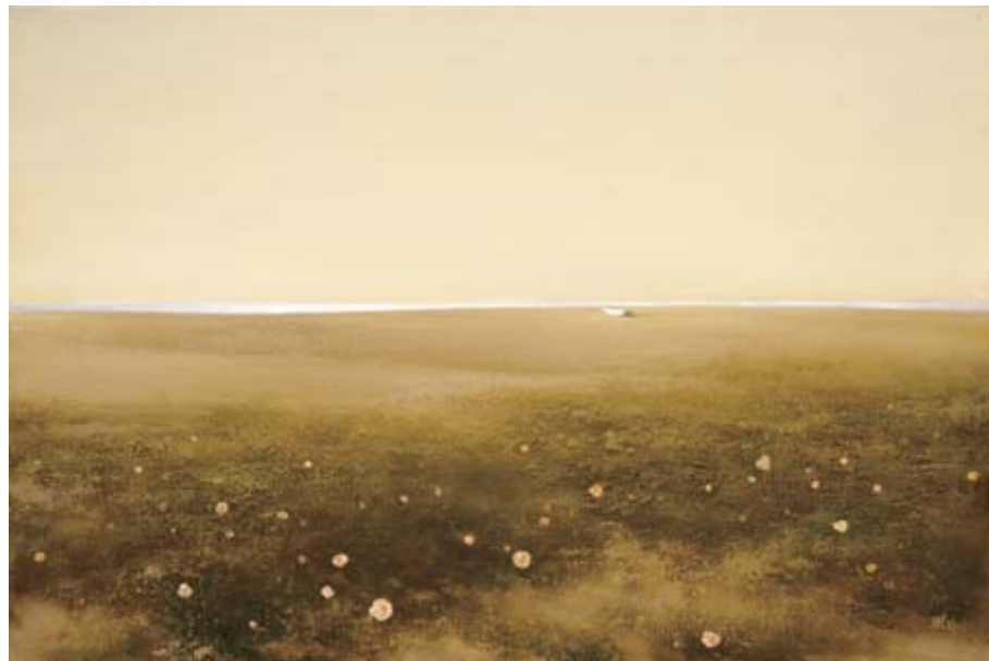
浜ひろがお 1997年 油彩・画布 60.6×90.9cm 一関市博物館所蔵

「掲示板」は毎月1日号に掲載します。 次回11月1日号の締め切りは10月7日④です。 詳しくは、本庁市政情報課広報係 ☎②8182へ。