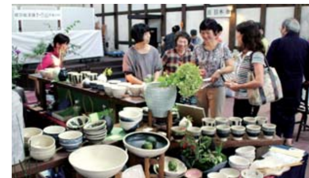
使い道を想像して手に取り楽しんでいました

一昨年まで旧内野小学校で行われていた実習を、昨年、統合した大原小で引き継いだもの。1400度ほどに加熱された溶鉱炉に砂鉄川で採取した約30キロの砂鉄と木炭を交互に投入し、約6時間後に炉を取り壊し、大きな鉄の塊「ケラ」が取り出されると、「すごい」などと歓声上がり、伝統の製鉄を体験していました。