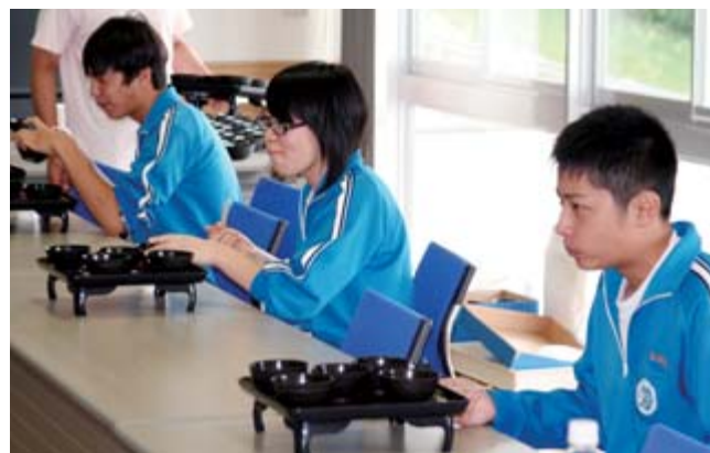
楽しみ、苦戦しながら餅を口にする中学生