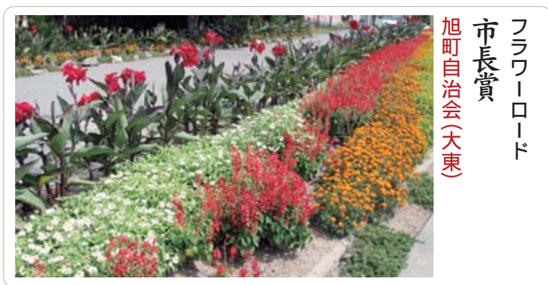
フラワーロード 市長賞 旭町自治会(大東)