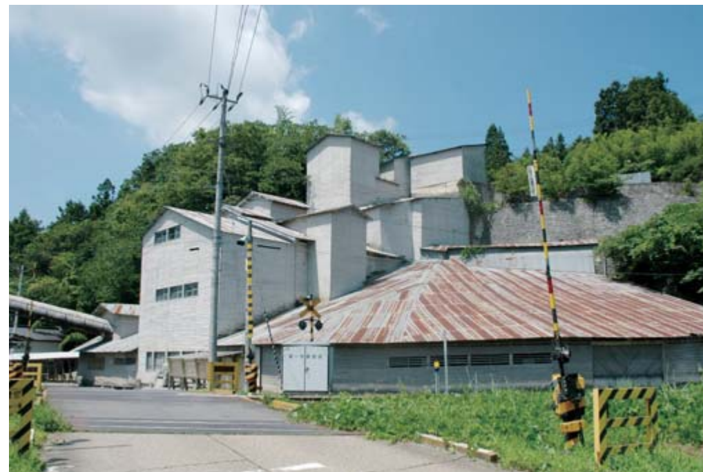
産業近代化遺産として国の登録有形文化財に指定されている旧東北砕石工場

「掲示板」は毎月1日号に掲載します。 次回10月1日号の締め切りは9月9日④です。 詳しくは、本庁市政情報課広報係 ☎8182へ。