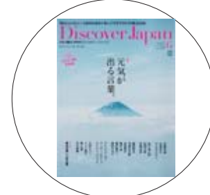
「Discover Japan Vol.16 ~特集 元気が出る言葉~」 樫出版社 発行

富士山の頂が雲の間からふわっと浮いている表紙は石川直樹氏の写真。ページをめくると、やなせたかし、安藤忠雄、松下幸之助、白州次郎、池波正太郎、植村直巳など戦後ニッポンを元気にした偉人達の「言葉」がたくさん登場します。