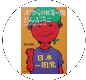
「ボクらの日本一周どんぶらこ ~きのびだんごを配って四千里~」 石井 達也 著

岡山出身の著者が、相棒と二人で出会った人たちに「きびだんご」を配りながら日本一周をしていく現代版「ももたろう」のような楽しくて元気が出る話。日本人特有の「お返し」の文化が随所に垣間見られ、その良さに改めて気付かせてもらえる一冊です。