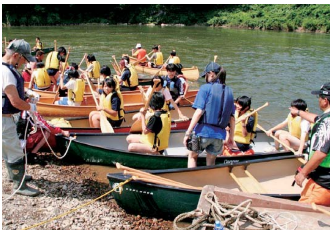
沈むことなく無事に帰ってこられるかな？さあ～！出発！

時こそ会員のアイデアが光ります。会員お手製の紙芝居やロープワーク、川の学習など、代わりの事業を用意し参加者を楽ませる工夫も決して怠りません。