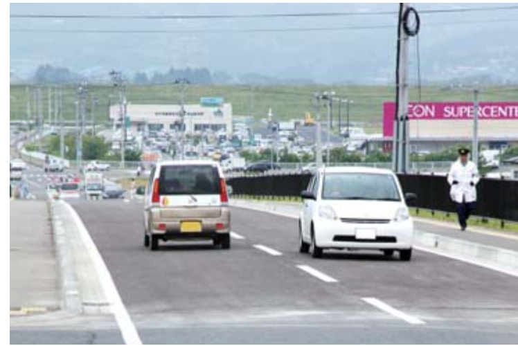
全線が開通した市道駅東前堀線

に着手し、総事業費は51億7千万円です。18年から整備が終了した区間で順次開通。本年の3月に全線が開通する予定でしたが、東日本大震災の影響により、工事中の区間で路面に亀裂や沈下が発生するなどの被害が確認されたことから復旧工事を行い、開通にこぎつけました。