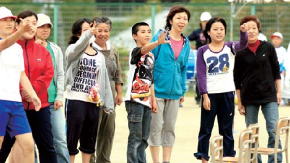
室根西小児童や父母らと一緒に協議を楽しむ小泉地区の人たち

市内小中学校は運動会シーズンを迎え、各地で児童生徒の歓声がこだましました。東日本大震災を受け、沿岸部との交流を盛り込んだ運動会を行った学校もあり、子供たちは、復興支援の思いを込め、元氣いっぱい競技に挑みました。