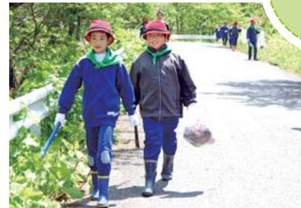
沿道に捨てられたごみを拾いながら歩く子どもたち