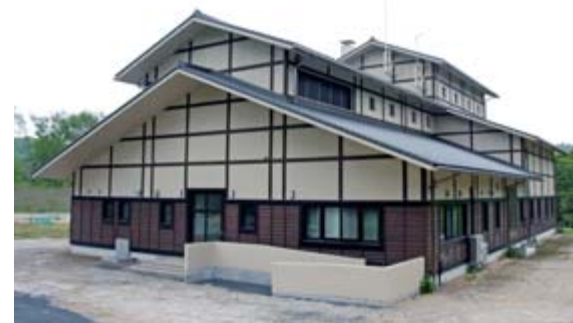
供用を開始した千厩浄化センター

市公共下水道千厩処理区の整備事業は、平成13年度に着手し、19年度からは千厩浄化センターの建設を行ってききました。