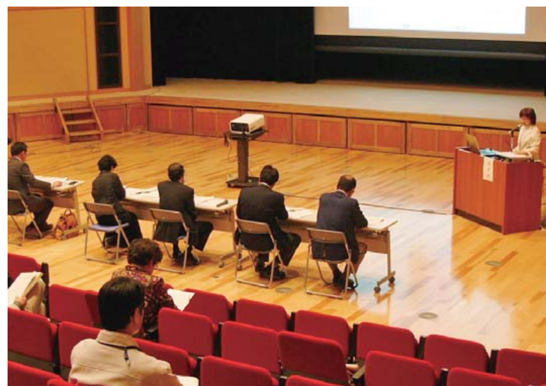
審査員8人を前に行われた、熱のこもったプレゼンテーション

市は、人材おこしや産業おこしなどに地域や民間団体が取り組む事業を支援することで、活力ある地域づくりを推進しようと、平成18年度から地域おこし事業を行っています。23年度は、申請のあった17事業について5月22日、公開プレゼンテーションによる審査を実施、意欲あふれる11事業を採択しました。 採択した事業は、▽地域おこし一般事業が7件、助成額322万5000円▽若者が主役事業が2件、助成額120万円、▽女性が主役事業が2件、助成額48万円。合わせて490万5000円の助成が決定しました。 本事業は、▽18年度59件▽19年度48件▽20年度40件▽21年度52件▽22年度33件の事業を採択し、それぞれ特色ある活動が展開されました。 23年度2回目募集は7月8日まで 本年度事業の2回目の募集