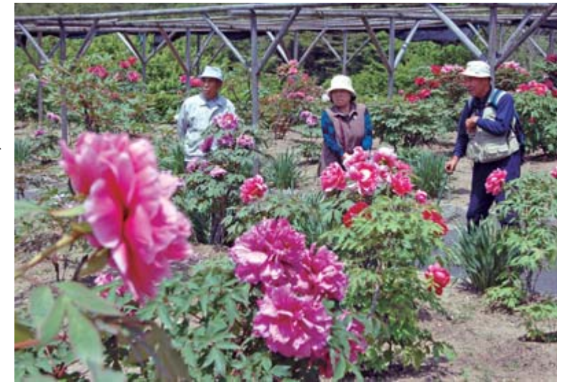
上/初夏の日差しを浴びて咲き誇るボタン 右/華麗に咲くボタンをバックに記念撮影する観光客

期間中は、仮装撮影会やチャリティー芸能発表会など復興イベントも開催され、にぎわいをみせた同園。5月下旬からは2000株のシャクヤクが見頃を迎え、観光客を楽しませてくれます。