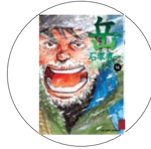
「岳 第14巻」 石塚真一 著

佐渡島に住む、まるで昔話から飛び出したかのような女の子「未来ちゃん」。天真爛漫すぎる姿に癒されます。 ページをめくるといろんな意味で安心してしまふ。そんな写真集です。