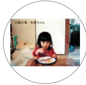
「未来ちゃん」 川島小鳥 著

佐渡島に住む、まるで昔話から飛び出したかのような女の子「未来ちゃん」。天真爛漫すぎる姿に癒されます。 ページをめくるといろんな意味で安心してしまふ。そんな写真集です。