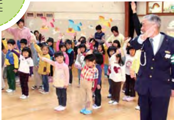
手を挙げて、右を見て左を見て

迷彩服に身を包んでヘルメット姿の隊員たちは、被災地への出発前に受け付けを済ませた後、記載台に向かい投票用紙に記入していました。