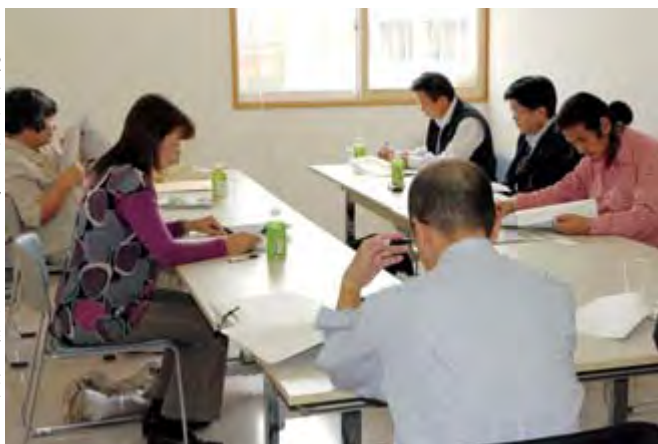
22年度に行われたモニター会議の様子

◇任期：委嘱の日から25年3月31日まで ◇謝礼：年額1万円 ◇応募方法：「二関市広報モニター申込書」（本庁市政情報課および各支所地域振興課に備え付けるほか、市ホームページからもダウンロードできます）に必要事項を記入の