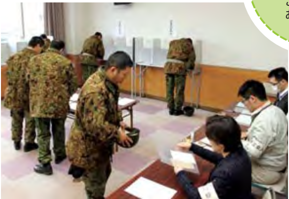
ヘルメットを携え、投票に訪れた自衛隊員