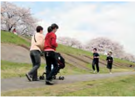
上／咲き誇る釣山のサクラを望む花見客 左／散策やジョギングを楽しむ人がたくさん訪れていました。

花見の名所として市民に親しまれている磐井川堤防の桜並木は、堤防改修に伴い、上の橋上流からJR橋りょうまでの107本が順次伐採されることとなっています。一方で、民間組織を交えた再生計画も進んでいます。