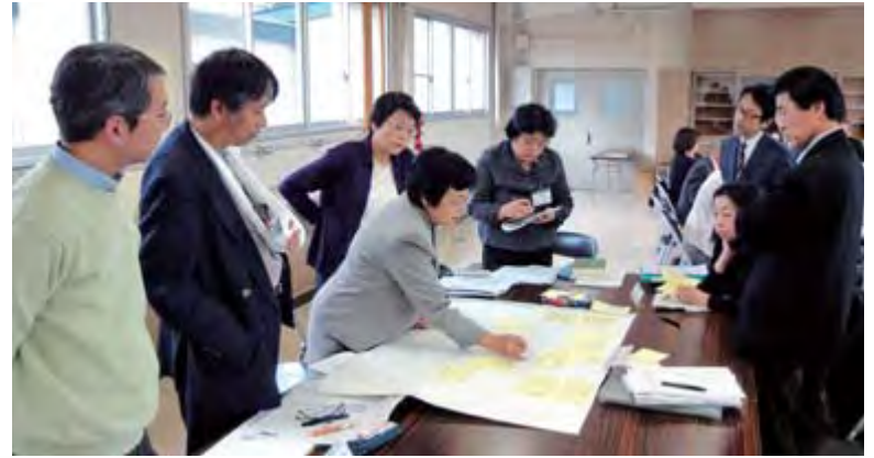
一関図書館整備計画委員会での検討の様子