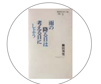
「雨の降る日は考える日にしよう」 柳田邦男 著

絵本は子供だけのものではありません。生涯を通し、生きる上で本当に大切なものは何かを気づかせてくれる心のとも…。著者が薦める44冊の絵本を紹介します。「大人が絵本に涙する時」に続く、待望の名作絵本です。