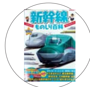
「新幹線ものしり百科 きれり!好奇心」 水谷隆介 著

全国を走っている新幹線をかっこいい写真とDVD映像で紹介。N700系の人気車両から東北新幹線「はやぶさ」を代表とするE5系や新800系の最新車両まで網羅。運転士さんや車掌さんの仕事など、知りたい情報がいっぱいです。