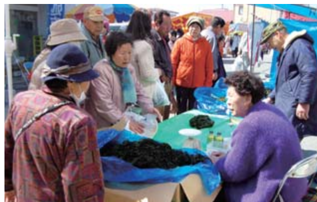
甚大な被害を受けた宮城県女川町から元気に参加された出店者