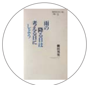
「雨の降る日は考える日にしよう」 柳田邦男 著

「思い立ったら、時を移さず」「自分の頭で考える」「ひとりで生きる」…兼好法師が遺してくれた数々の言葉。人生の達人・清水妙の最高の生き方エッセイ。元氣と勇気たっぷりの生き方読本です。