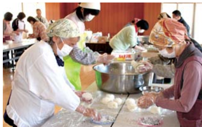
1日でも早い復興を願って