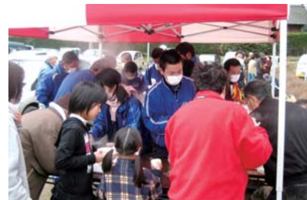
豚汁とおにぎりの炊き出しを行う大東高校の生徒