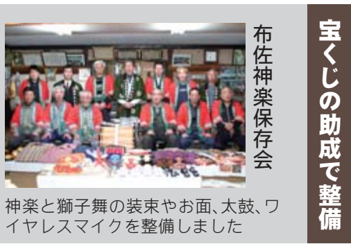
宝くじの助成で整備