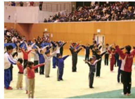
上/高い難度の技を披露した内村航平選手 左/畠田監督から「胸を張って、目線は上」と「決めのポーズ」の指導を受ける児童たち