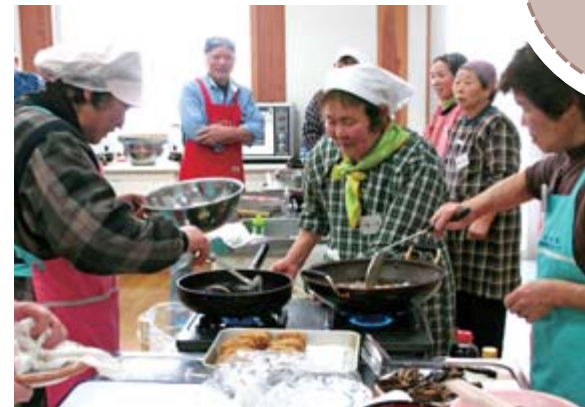
地元で採れたタケノコで4種類の料理を習った参加者