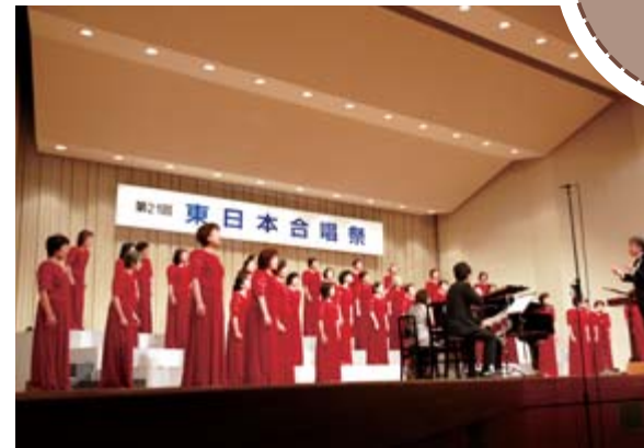
華やかなハーモニーを響かせた浦和女声合唱団