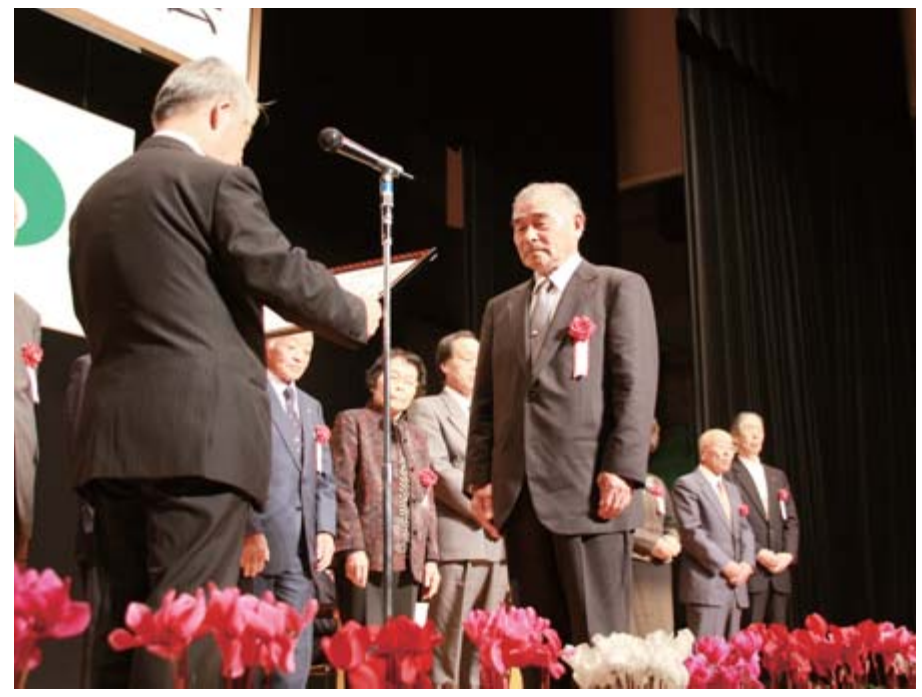
地域振興への活動に対し表彰状が贈られました

22年度一関市民憲章推進大会（一関市民憲章推進協議会主催）は10月26日、同協議会関係者や市民ら約350人が出席し、一関文化センターで行われました。