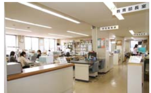
本庁舎5階に移転した教育総務課、学校教育課

県立清明支援学校の移転整備に伴い、これまで分庁舎（一関二高清水校舎）で業務を行っていた農業委員会事務局が本庁舎に、教育委員会事務局が本庁舎と一関地区合同庁舎に移転し、10月25日から業務を開始しました。このことに伴い、本庁舎の事務室配置を左表のとおり変更しました。記載していない課などは変更ありません。移転した各課などの電話番号は左表のとおりです。