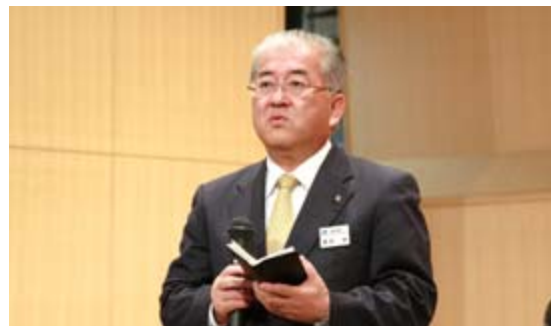
あいさつを述べる勝部市長 (川崎公民館)