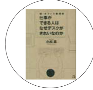
「超・オフィス整理術 仕事ができる人はなぜデスクがきれいなのか」 小松 易 著

本書は片づける場所を職場に限定し、片づけのノウハウを惜しみなく紹介しています。著者である小松氏は「日本初のかたづけ士」と称し、現在まで2000人以上に片づけを指導。11月には、川崎図書館での講演会も予定されており、お悩みの人は必見です！